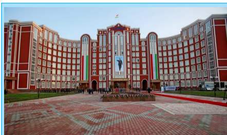
МУАССИС: Академияи Вазорати корҳои дохилии Ҷумҳурии Тоҷикистон