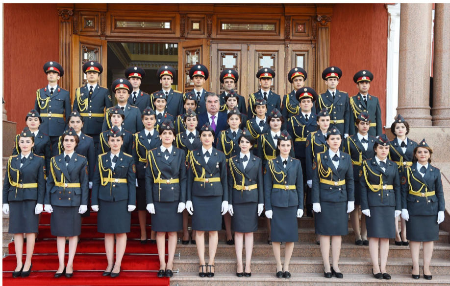
(Аввалин дар саҳ.1)

Паёми шодбошӣ ба муносибати Рӯзи ҷавонони Тоҷикистон, 23.05.2022 сол