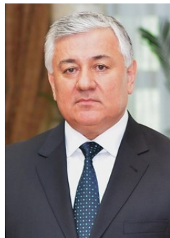
ШЕРМУҲАММАД ШОҲИЁН РАИСИ СУДИ ОЛИИ ҶУМҲУРИИ ТОҶИКИСТОН