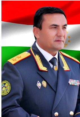
АЛАМШОЗОДА АБДУРАҲМОН АЛАМШО Муовини якуми вазири корҳои дохилии Ҷумҳурии Тоҷикистон, ГЕНЕРАЛ-ЛЕЙТЕНАНТИ МИЛИТСИЯ