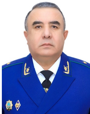
КАРИМЗОДА УМЕД РАҲМАТШО Муовини якуми Прокурори Генералии Ҷумҳурии Тоҷикистон, мушовири давлатии адлияи дараҷаи 3