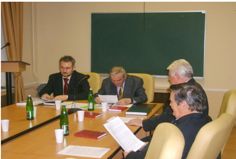
Заседание совета по защите диссертации