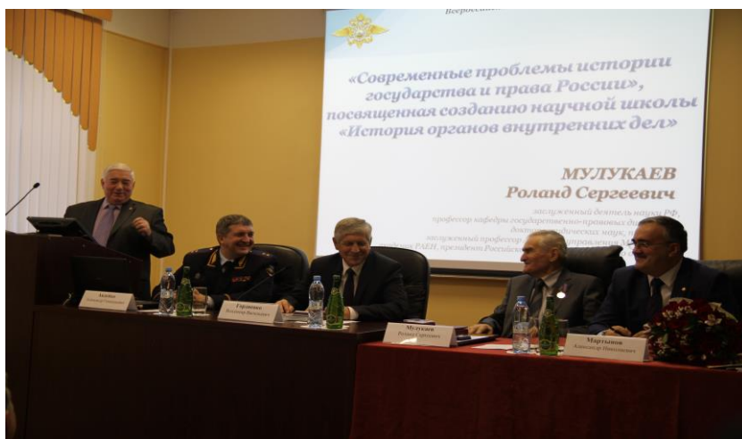
Конференция, посвященная 85-летию Р.С. Мулукаева. Москва, 2014 г.