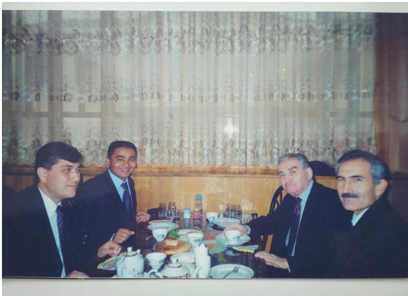
В дружеской обстановке в чайхоне «Рохат». Душанбе, 2005 г.