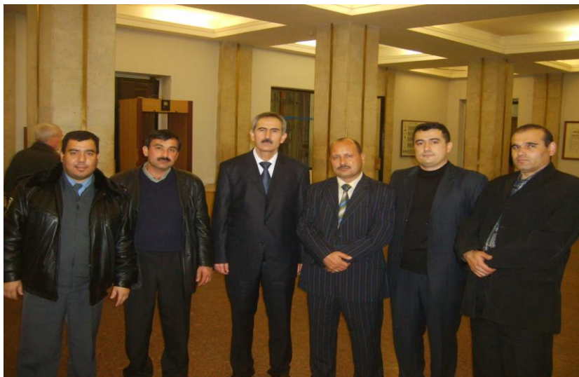
Адъюнкты и докторанты Таджикистана в АУ МВД РФ. М., 2007 г.