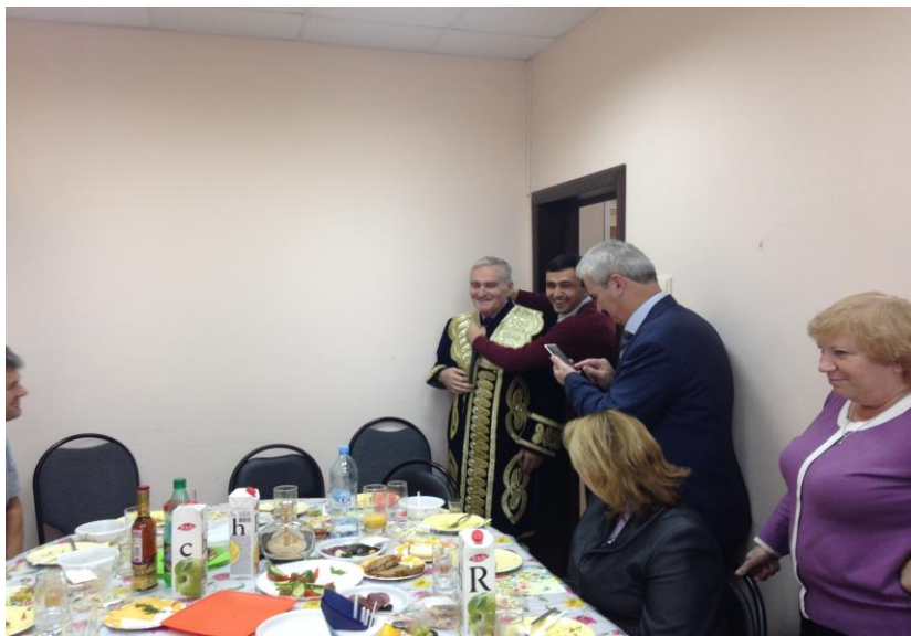
Ученик поздравляет своего учителя с 85-летием