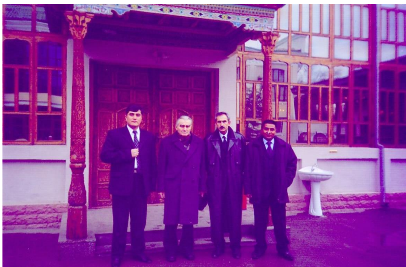
Встреча с учениками. Душанбе, 2005 г.