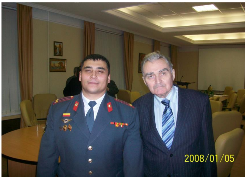
Учитель с учеником. М., 2008 г.