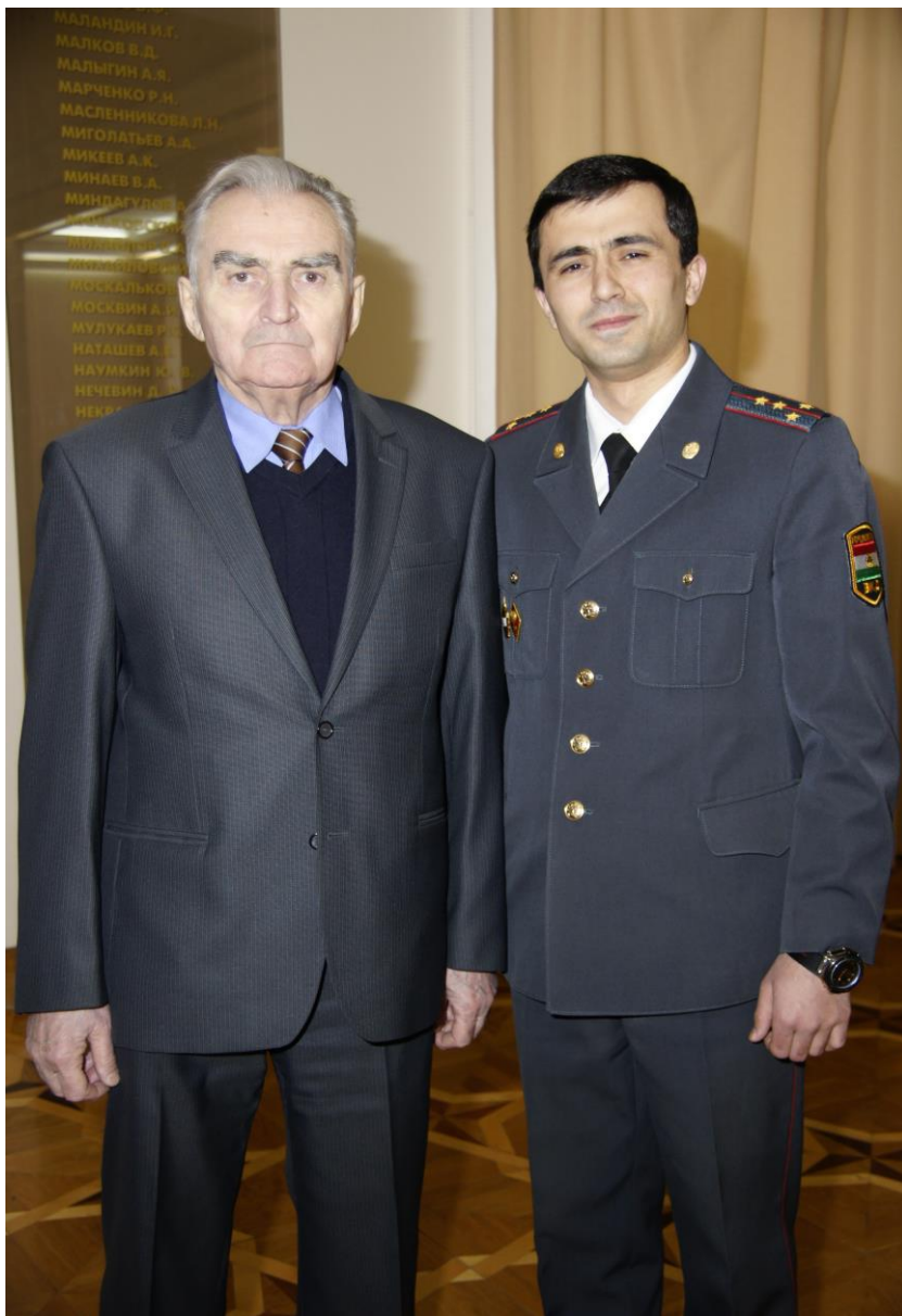
Ученик с учителем. М., 15.01.2014 г.